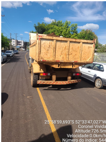
Rua Frederico Berger