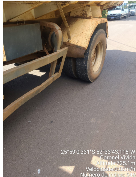
Rua Ivo Buschman