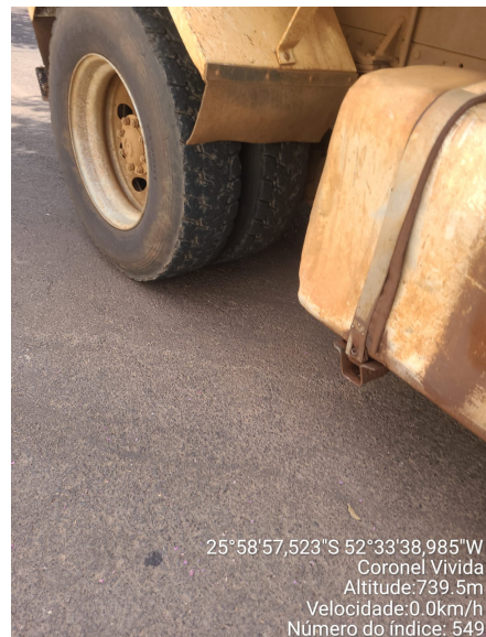
Rua José de Lima Pacheco