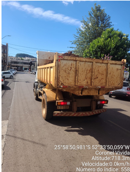
Rua Sete de Setembro