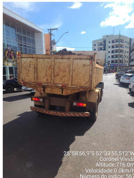
Rua Claudino dos Santos