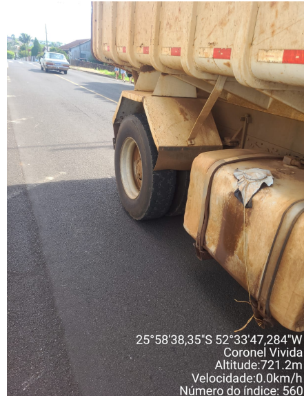
Rua Olavo Bilac