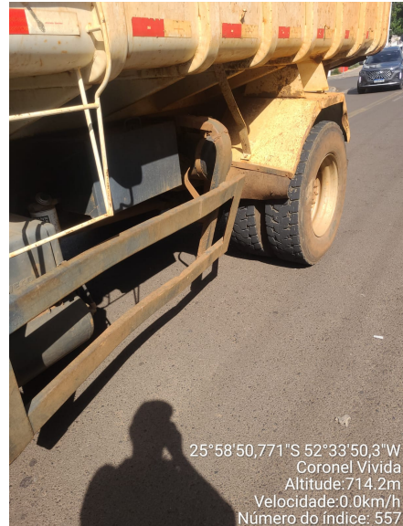
Rua Sete de Setembro