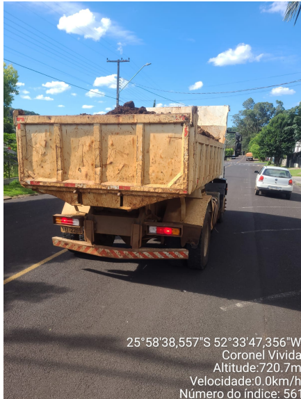
Rua Olavo Bilac