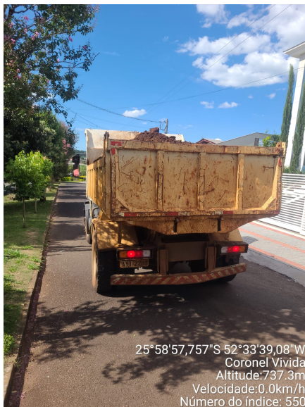
Rua José de Lima Pacheco