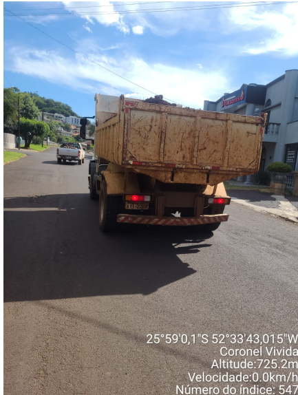
Rua Ivo Buschman