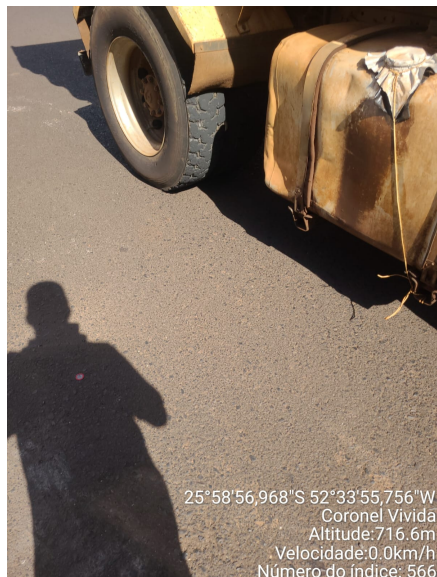
Rua Claudino dos Santos