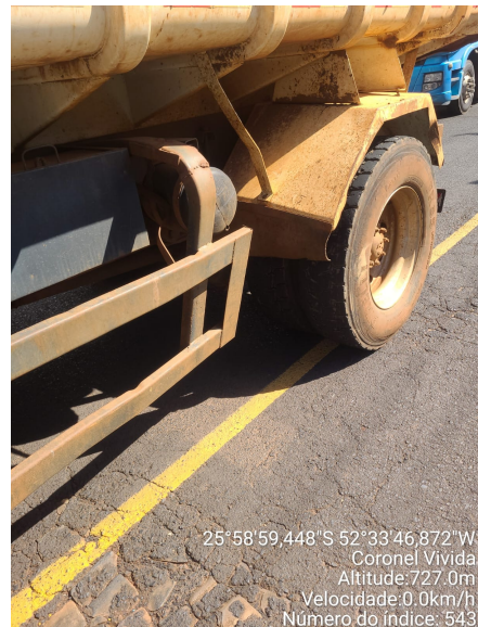
Rua Frederico Berger