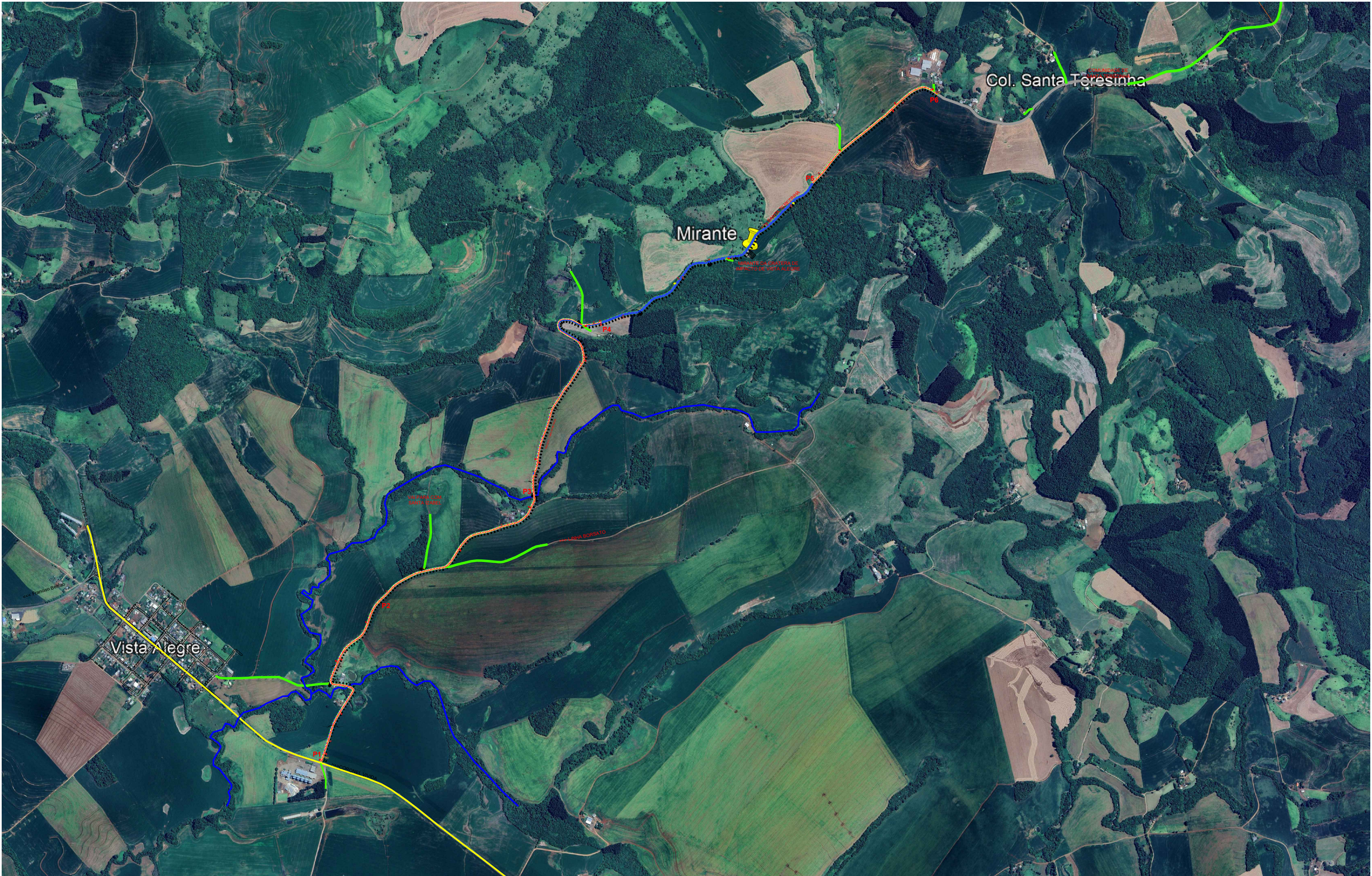
PLANTA DE SITUAÇÃO – ÁREA DE INTERVENÇÃO