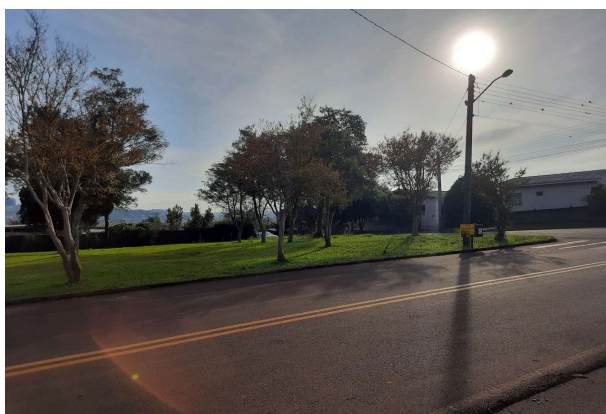
FOTO 3 - VISTA LATERAL ESQUERDA