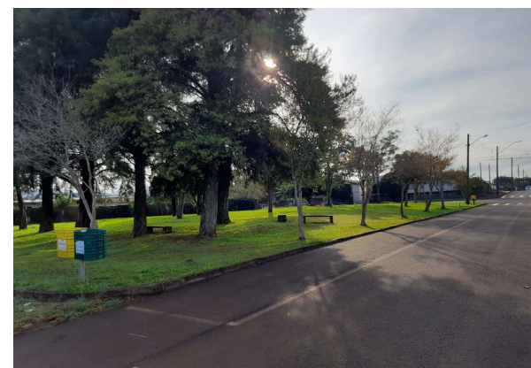
FOTO 6 - VIA DE ACESSO E ENTORNO