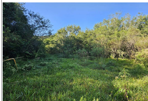
FOTO 5 - ÁREA ANTIGO CAMPO DE FUTEBOL