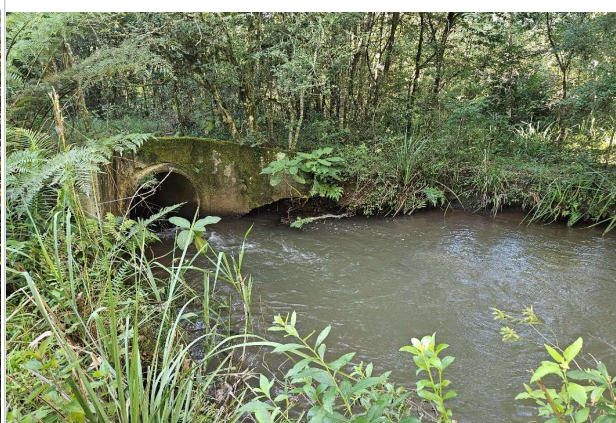
FOTO 2 - Rio Barro Preto - Objeto da Bacia de contenção