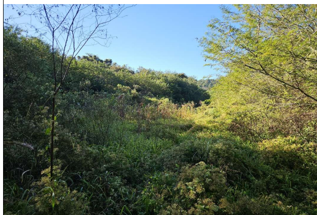
FOTO 3 - ÁREA ANTIGO CAMPO DE FUTEBOL