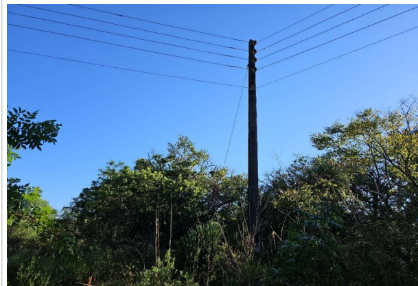
FOTO 10 - Rede elétrica