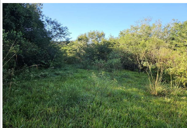
FOTO 9 - Entrada da área de intervenção