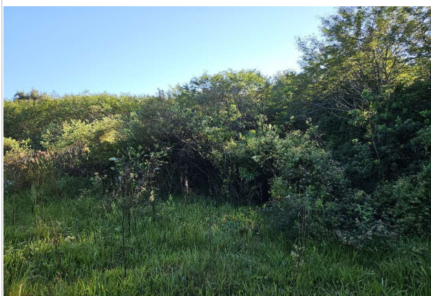
FOTO 8 - ÁREA ANTIGO CAMPO DE FUTEBOL