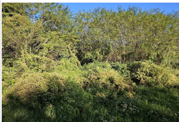
FOTO 7 - ÁREA ANTIGO CAMPO DE FUTEBOL

Município: CORONEL VÍVIDA Projeto: Outros