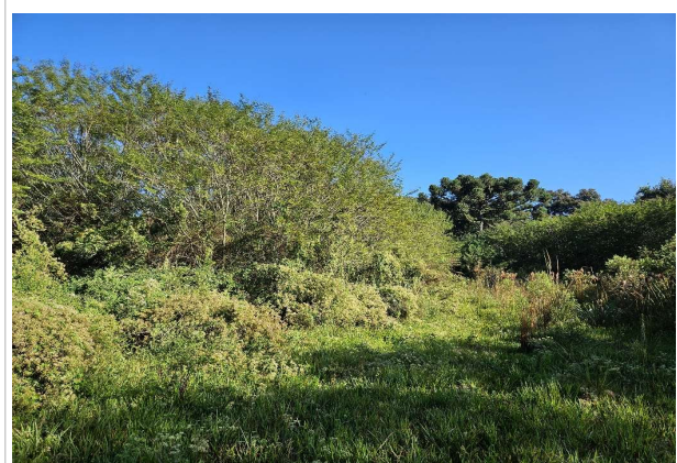
FOTO 6 - ÁREA ANTIGO CAMPO DE FUTEBOL