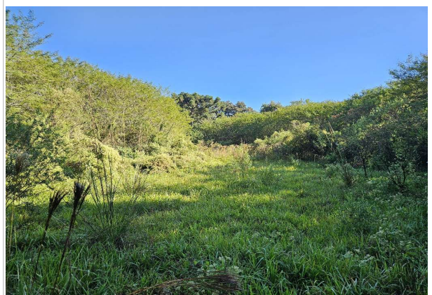
FOTO 4 - ÁREA ANTIGO CAMPO DE FUTEBOL